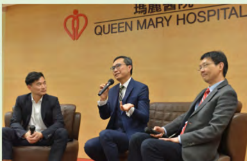
陸醫生與兩位嘉賓交流人才管理之道