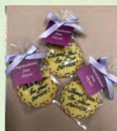
聯網為得獎同事準備的小心意