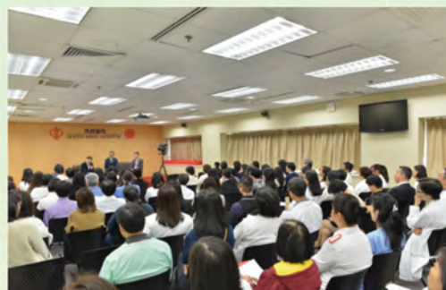
首兩場分享會叫好叫座，同事坐滿K座二樓醫生休息室